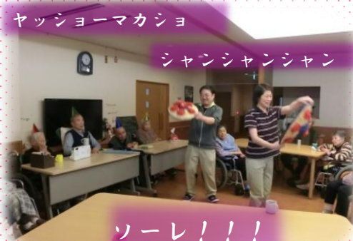
ヤッショーマカショ