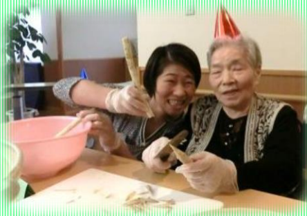
あなたは何もらったの？