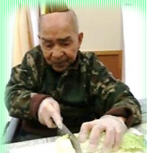
男らしい包丁裁き