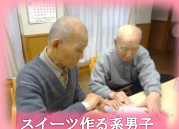
スイーツ作る系男子